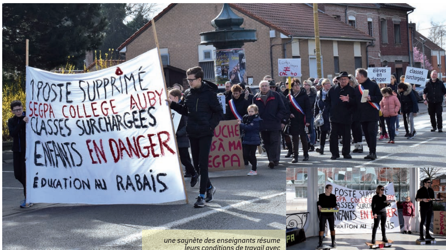
une saynète des enseignants résume leurs conditions de travail avec des moyens en baisse

Une phrase lancée à l'issue de la mobilisation par une enseignante qui conclut fort à propos les mesures prises en direction de la Segpa.