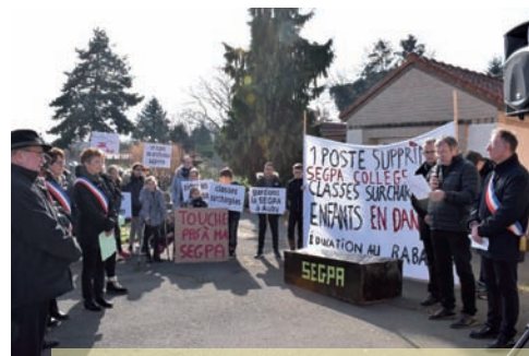
Prises de paroles au cimetière pour le symbole

Un soutien indéfectible qui s'accompagne d'un courrier adressé au ministre de l'Education nationale, Jean-Michel Blanquer lui rappelant, arguments à l'appui, les incohérences de ses décisions politiques gouvernementales.