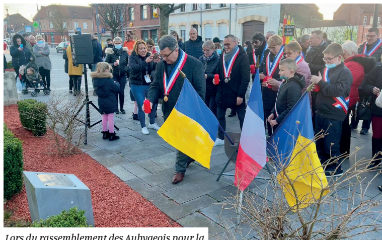
Lors du rassemblement des Aubysgeois pour la paix en Ukraine