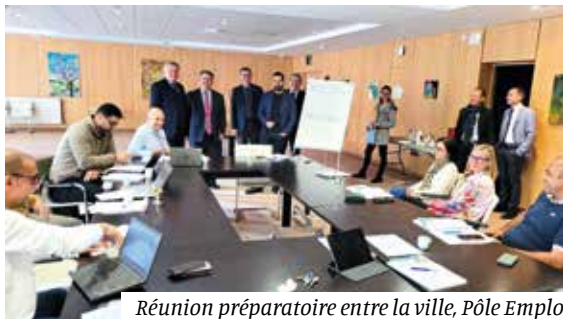
Réunion préparatoire entre la ville, Pôle Emploi et les services de l'Etat dans le cadre de la mise en place d'une action en faveur de l'emploi au sein des quartiers.

C'est avec entrain et plaisir qu'il a participé à une partie de billon, constatant par la même occasion, la vitalité et diversité du tissu associatif aubygeois.