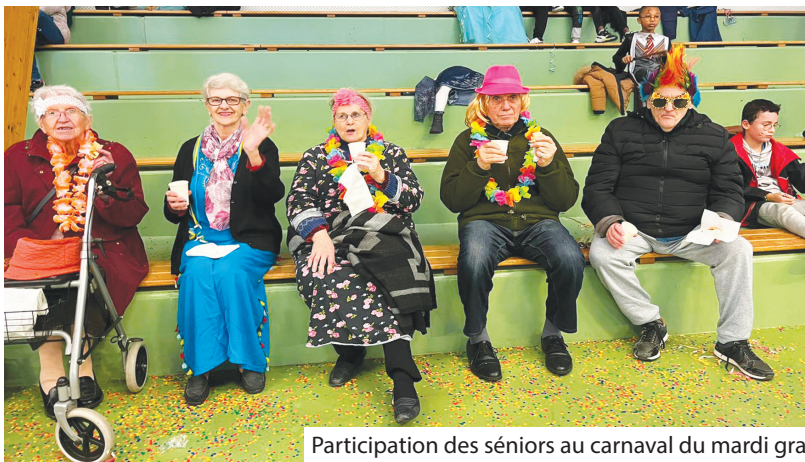
Participation des séniors au carnaval du mardi gras

LE SENS DU PART'ÂGE, PROJET INTERGÉNÉRATIONNEL VISANT À ENTREtenir UN LIEN SOCIAL ENTRE NOS AÎNÉS ET NOS JEUNES BÉNÉVOLES SE POURSUIT. DURANT LE MOIS DE MARS, DE NOUVELLES ACTIVITÉS ONT ÉTÉ MISES EN PLACE.