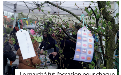
Le marché fut l'occasion pour chacun d'inscrire un souhait sur l'arbre à mots.