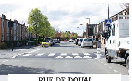
RUE DE DOUAI installation de trois ralentisseurs