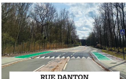
RUE DANTON installation d'un ralentisseur et de deux coussins