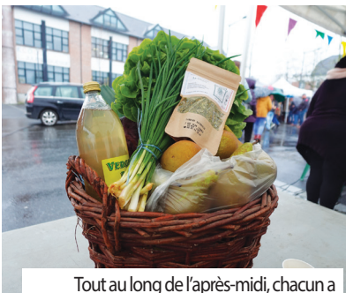
Tout au long de l'après-midi, chacun a pu s'essayer à déterminer le poids d'un panier garni à gagner. L'heureuse gagnante est repartie avec un joli lot de 15,835kg, composé de poireaux, navets, carottes, chou rouge, pommes, poires, jus de pomme, vert d'échalote, salade et tisane au CBD.