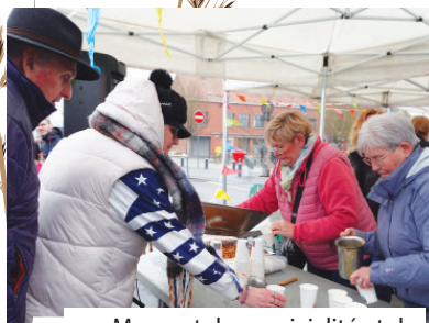
Moment de convivialité et de gourmandise autour de la soupe.