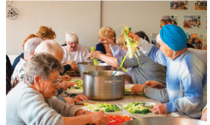
Une délicieuse soupe, offerte par la municipalité, a été concoctée par les résidents et le personnel de la Résidence Beauséjour, ainsi que les élus.