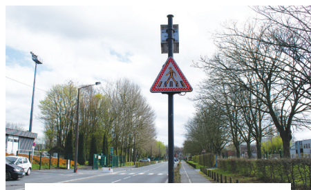
RUE JEAN-BAPTISTE LEBAS installation de deux éclairages publics de passage piéton