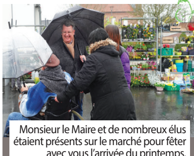
Monsieur le Maire et de nombreux élus étaient présents sur le marché pour fêter avec vous l'arrivée du printemps.