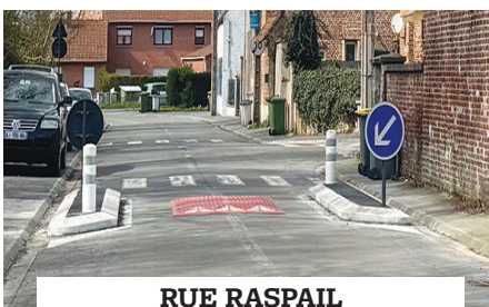
RUE RASPAIL installation de deux écluses avec coussin