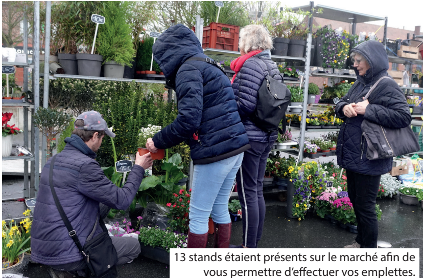
13 stands étaient présents sur le marché afin de vous permettre d'effectuer vos emplettes.

et musicale. Stands de produits locaux, d'alimentation et d'artisanat, ainsi qu'un food truck proposant des pizzas cuites au feu de bois, étaient au programme.