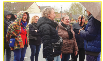
De nombreuses animations avec à la clé des surprises à gagner ont rythmé cette fin d'après-midi.