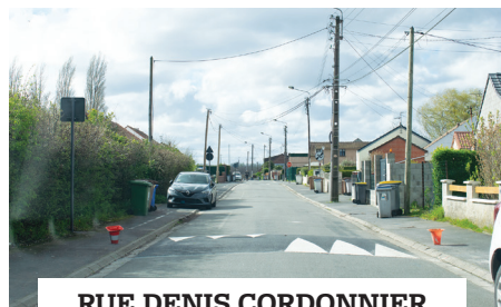
RUE DENIS CORDONNIER installation d'un ralentisseur

DANS UNE DÉMARCHE DE SÉCURISATION DE L'ESPACE PUBLIC, LA MUNICIPALITÉ A SOUHAITÉ ENGAGER DES TRAVAUX D'AMÉNAGEMENT DES VOIRIES PERMETTANT DE RÉDUIRE LA VITESSE SUR DES ZONES ACCIDENTOGÈNES. AINSI, DURANT LE MOIS DE MARS, LA POSE DE NEUF RALENTISSEURS ET DE DEUX ÉCLAIRAGES PUBLICS DE PASSAGE PIÉTON ONT ÉTÉ ENTREPRIS.