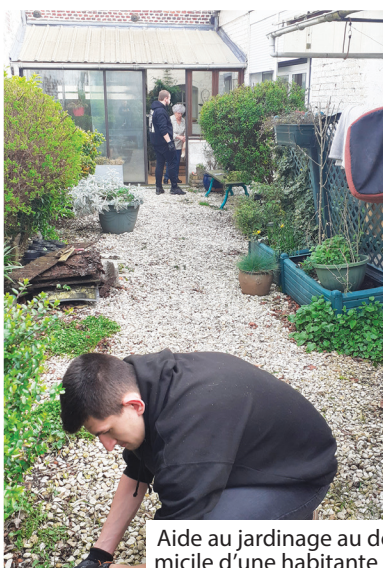
Aide au jardinage au domicile d'une habitante