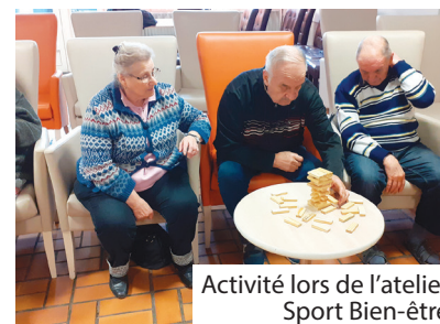
Activité Sport Bien-être