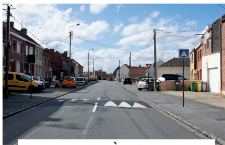
RUE DES FRÈRES DUYME installation d'un ralentisseur