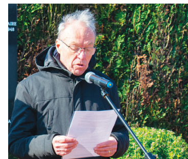
Prise de parole du président des Amis du PP.